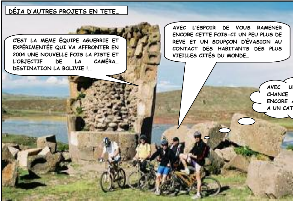
DÉJÀ D'AUTRES PROJETS EN TÊTE...

C'EST LA MEME ÉQUIPE AGUERRIE ET EXPÉRIMENTÉE QUI VA AFFRONTÉ EN 2004 UNE NOUVELLE FOIS LA PISTE ET L'OBJECTIF DE LA CAMÉRA... DESTINATION LA BOLIVIE !..