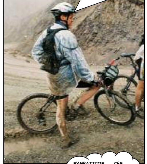
DES CONDITIONS DE PRÉFÉRENCES DIFFICILES...